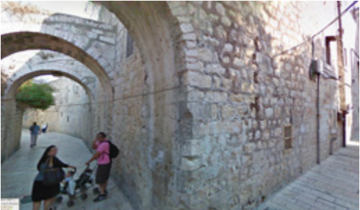
רחוב סנט ג'יימס