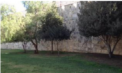
רצועה ירוקה בסמוך לשער החדש