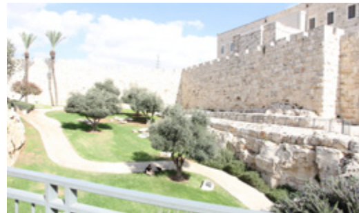
גינה תחתונה כיכר צה"ל