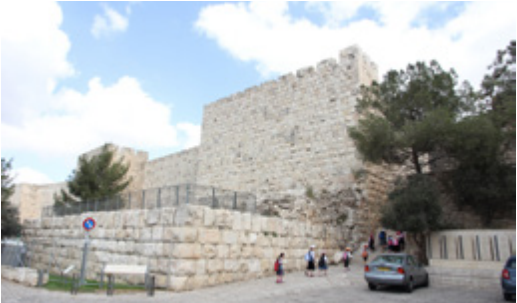
גן הבונים ג'