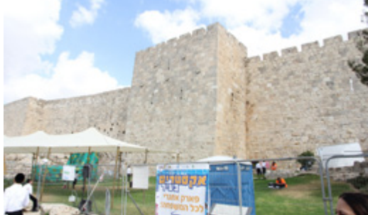
גן הבונים ב'