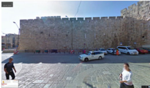
רחבה פנימית שער יפו