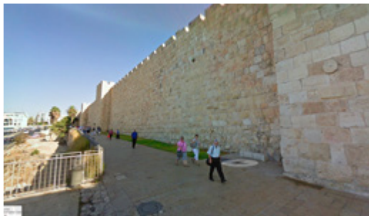
חומת העיר העתיקה