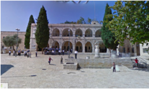
כיכר בתי מחסה