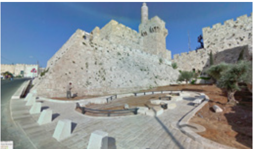
גינה חיצונית וחומת מגדל דוד